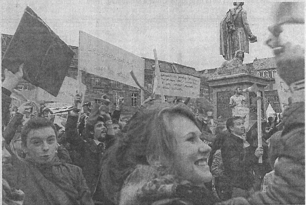
Des débats riches et des propositions fortes portées jusque sur la place Kléber vendredi : les 2 500 participants de la Convention ont déployé une formidable énergie.

TELEMENT DE CHOSES à dire... et tellement de discours à écouter ! Dans l'hémicycle du Parlement européen, aussi comble que ses tribunes, 1500 (les lieux ne pouvant en contenir plus) des 2500 jeunes de 15 à 25 ans présents à Strasbourg pour la convention des MJC (Maisons de la jeunesse et de la culture) ont enchaîné les olas et les applaudissements spontanés entre les nombreux discours officiels qui leur étaient réservés. Une alternance d'énergie et de respect rarement observée dans le lieu des débats mensuels entre eurodéputés... La veille, pancartes porteuses d'espoirs, d'idées, de messages d'égalité, ils avaient fait un happening, place Kléber, avant